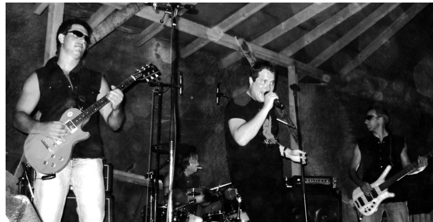
Der guten alten Rockmusik verfallen: Minirock aus Walenstadt.

Mels. – Trotz nicht optimalen Bedingungen aus Sicht des Wetters liess sich kein echter Harley-Freak die Laune verderben und reiste trotzdem mit seiner Maschine nach Mels. Am Freitagabend eröffnete die Rockband Minirock aus Walenstadt das Fest. Mit guter Laune und top organisiert ging die Eröffnung reibungslos über die Bühne. Minirock aus Walenstadt bot im traditionellen Stil Rock vom Feinsten. Der Auftritt stand unter dem Motto «Auf Teufel komm raus». Eine spezielle Einlage wurde mitten im Konzert vorgeführt: Mit einem echten, unverkennbaren Harley-Davidson